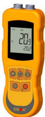
Рисунок 17 – Общий вид термометров контактных цифровых ТК-5 модификации ТК-5.11C