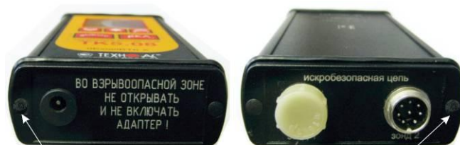
Пломбировка углублений с крепежными винтами пластикой FIMO с последующим оттиском клея