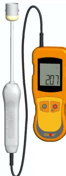
Рисунок 7 – Общий вид термометров контактных цифровых ТК-5 модификации ТК-5.01ПТС