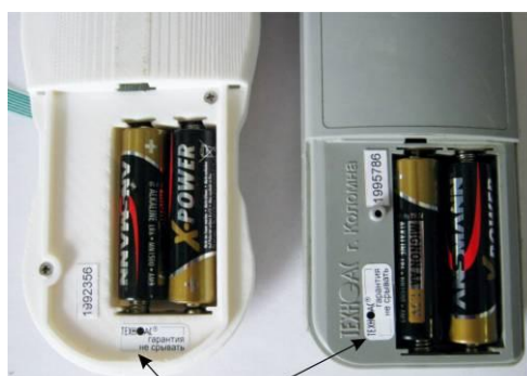
Место установки наклейки «Гарантия»: на винт, закрепляющий крышку с корпусом

Схема пломбировки термометров от несанкционированного доступа приведена на рисунке 43.