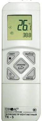
Рисунок 13 – Общий вид термометров контактных цифровых ТК-5 модификации ТК-5.11